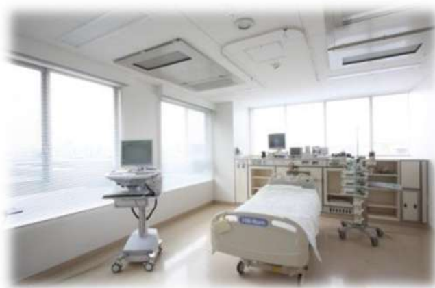
★ICU 8床 開放的