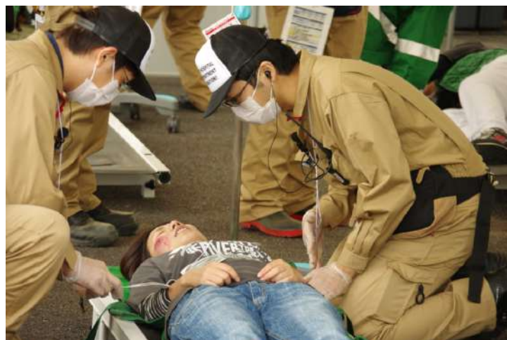
★奈良メディカルラリー参戦