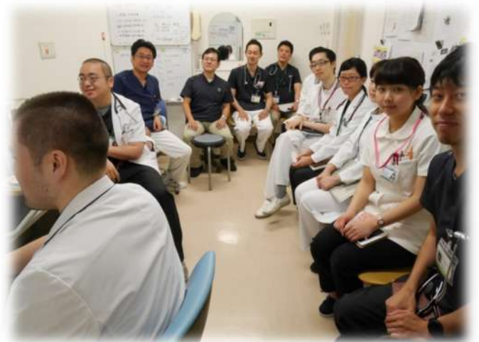
★ある朝のカンファレンス